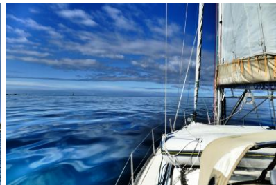
Passage du Four