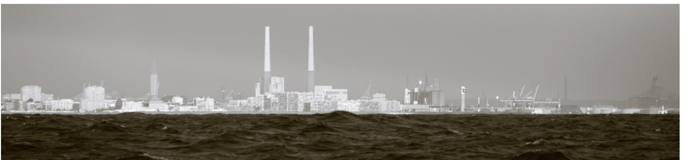
Euh... Le Havre ?