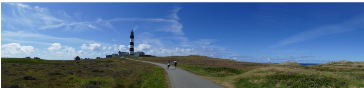
Ouessant – Le Creach