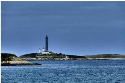
Aber Wrac'h – Phare de l'île Vierge