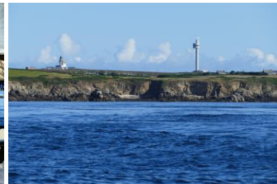
Ouessant – Le Stiff