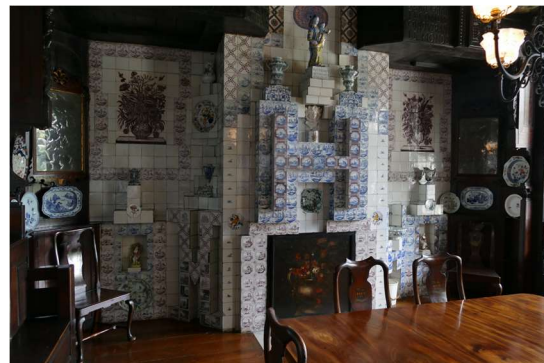
Guernesey – Maison Victor Hugo