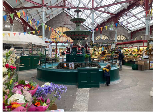
Jersey – Marché couvert