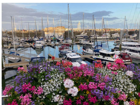
Guernesey – Saint Peter