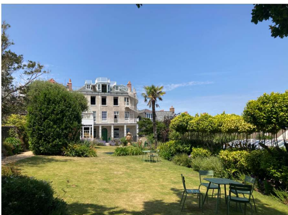
Guernesey – Maison Victor Hugo