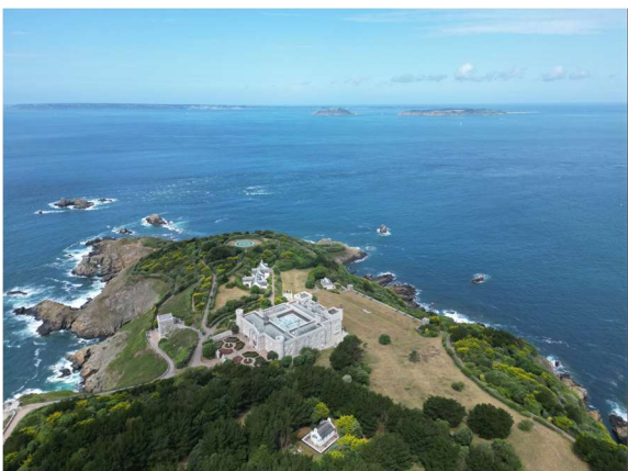
Sark – Le château