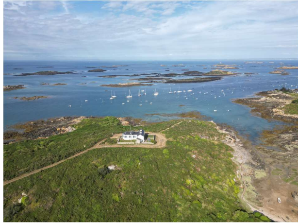
Chausey – Le Sound