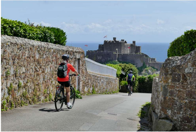
Jersey – Château de Mont-Orgueil