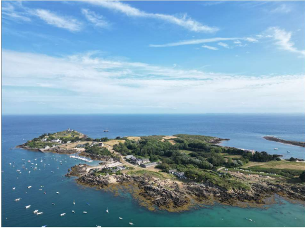
Chausey – Grande Ile