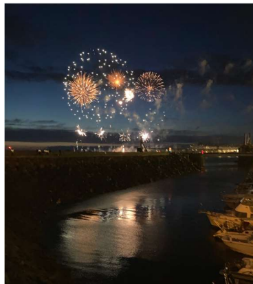
14 juillet aux Bas Sablons