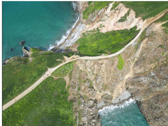
Sark – La Coupée