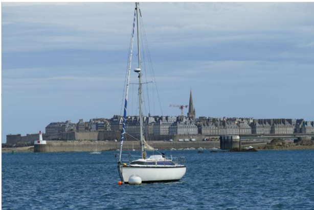
Saint Malo – Les remparts