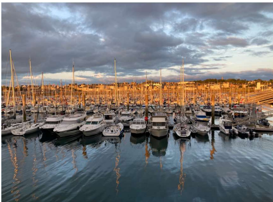
Les Bas Sablons